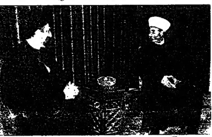
سجاعة المفتي خالد وسجاعة الامام الصدر